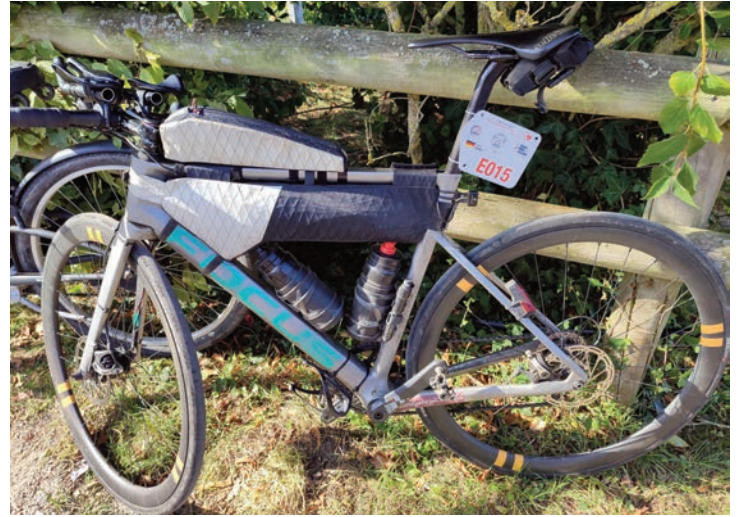
La bicyclette de Lucas Becker (20 e ) équipée également pour l'autonomie totale. Lucas, prévoyant, a réalisé une belle performance en réalisant 46 h 58' malgré son départ dans une vague permettant un délai de 90 heures.

Vélo pliant Moulton du Thaïlandais Winai Thanthranon. Les Asiatiques sont très friands des vélos pliables haut de gamme. Ils n'hésitent pas à parcourir de longues distances avec ces bicyclettes même si cela relève d'un véritable défi !