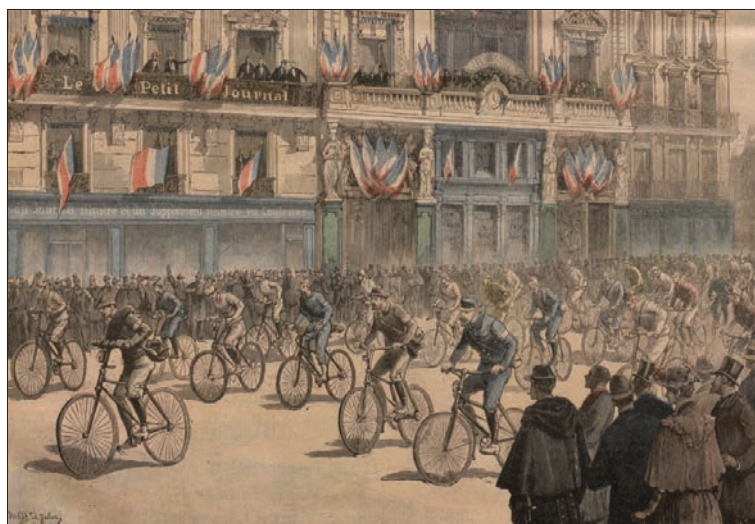
1891, départ du premier Paris-Brest-Paris (illustration "Le Petit Journal").

De par son histoire, Paris-Brest-Paris mérite les qualificatifs d'épopée, de légende. Aujourd'hui, avec son savoureux cocktail alliant performance chronométrique et cyclotourisme, elle fait de plus en plus